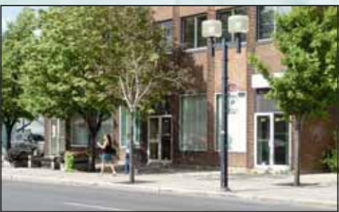
ÉDITION ET RÉDACTION : L'ÉQUIPE DE L'APAMM-RS CONCEPTION : PUBLISTEF COMMUNICATION IMPRESSION : LE GROUPE LAURIER

FAITES LE PREMIER PAS : APPELEZ-NOUS AU 450.677.5697. NOUS FERONS LES AUTRES PAS ENSEMBLE !